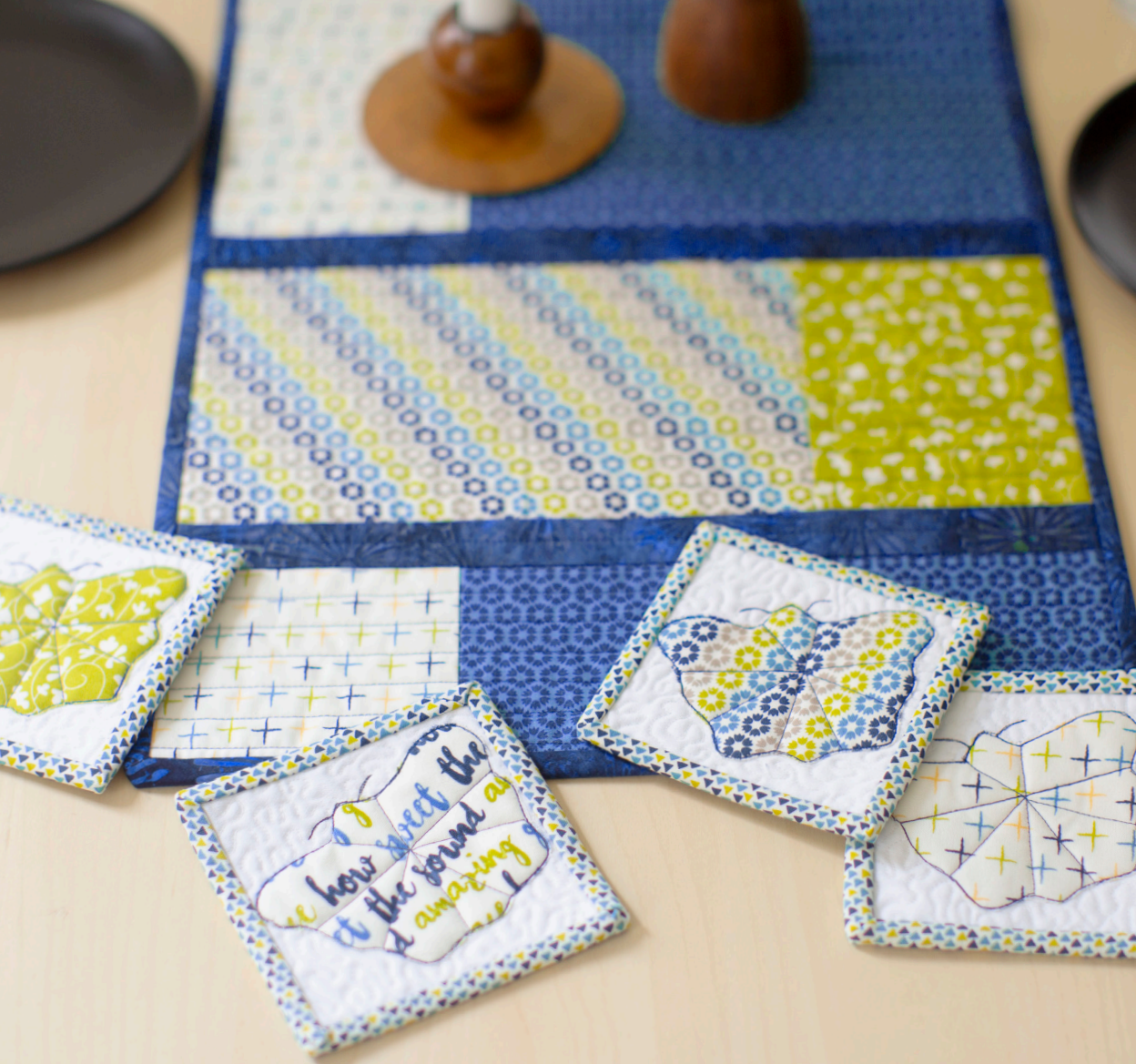
Diane Kron • "Harmonie de la Table "