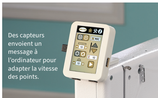
Des capteurs envoient un message à l'ordinateur pour adapter la vitesse des points.