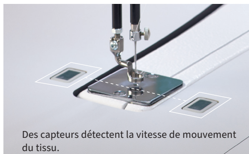
Des capteurs détectent la vitesse de mouvement du tissu.