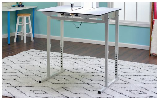
Table à réglage facile

Accédez à vos options matérielles et logicielles, à vos options d'éclairage, à vos compteurs de points et plus encore grâce à l'écran tactile LCD intuitif.