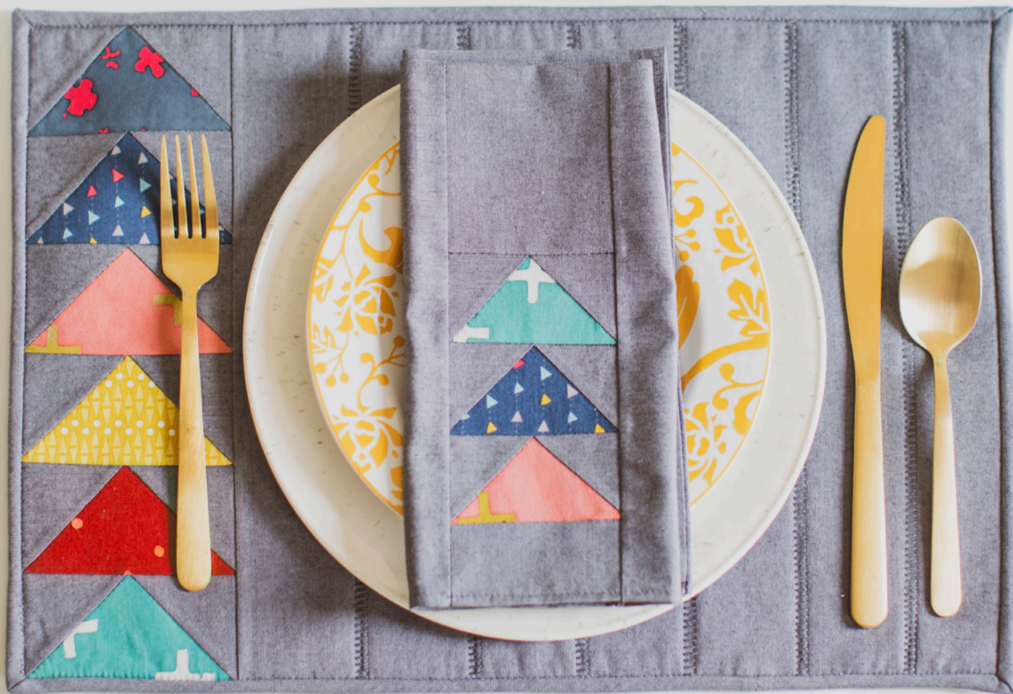
Chris Tryon • "Envol d'Oies pour le Souper"